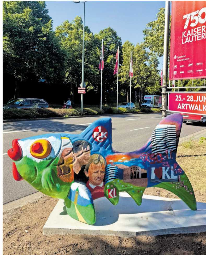
Den Schulwettbewerb des Bildungsbüros zur Gestaltung eines Fisches hat die Kurpfalz-Realschule plus gewonnen