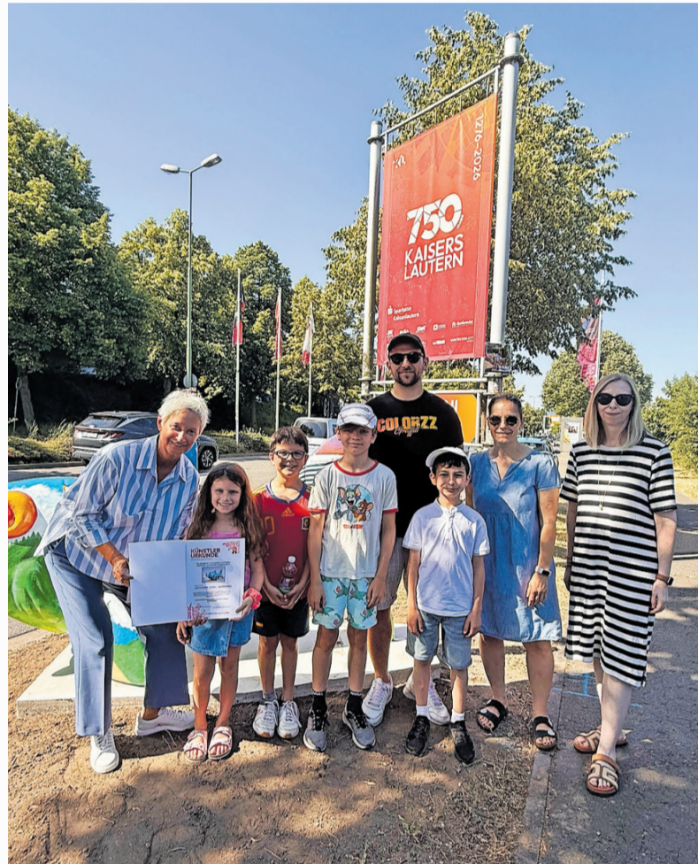
Impressionen von der Einweihung mit Oberbürgermeisterin Beate Kimmel

Rahmen der Aktion „Frische Fische für Kaiserslautern“, bei der Bürgerinnen und Bürger, Schulen, Vereine und Initiativen ihre Gestaltungsideen einreichen konnten. Die Gewinnerentwürfe wurden in den vergangenen Wochen auf die Fischrohlinge übertragen und sind nun im Stadtbild angekommen. jps