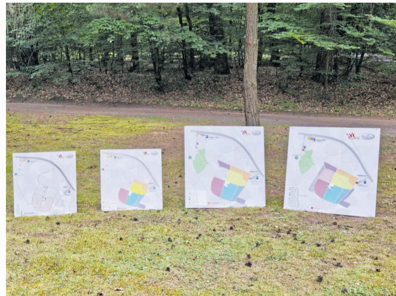
Die Entwicklung des Ruheforsts ist an den Hinweistafeln von links nach rechts gut erkennbar

Wer sich für den Ruheforst interessiert, ist herzlich eingeladen, sich bei einer kostenlosen Führung zu informieren, die einmal im Monat sonntags stattfindet. Der Treffpunkt ist am Parkplatz West 1 an der Mannheimer Straße stadtauswärts. Festes Schuhwerk ist auf den Waldwegen von Vorteil, eine Anmeldung ist nicht notwendig. |ps