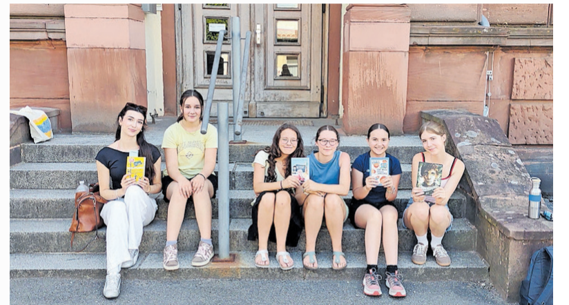
Die Vorleserinnen vom Albert-Schweitzer-Gymnasium an der Luitpoldschule

Und hier ist man sich ebenfalls sicher: Auch im nächsten Jahr wird das Projekt „Große lesen Kleinen vor“ fortgesetzt werden. |ps