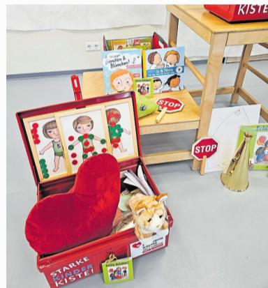
Die „Starke Kinder Kiste“ enthält vielfältige Materialien für eine nachhaltige Präventionsarbeit

sechs Kindertagesstätten genutzt werden. Ein Verbund aus je drei Kitas teilt sich eine Kiste: Die Kita Kleine Strolche, die Kita Waldwichtel und die Kita Lummerland nutzen eine Kiste sowie die Kita Tausendfüßler, die Kita Kinderwelt und die Kita Villa Winzig. Da die „Starke Kinder Kiste“ jeweils sechs Wochen in Benutzung ist und