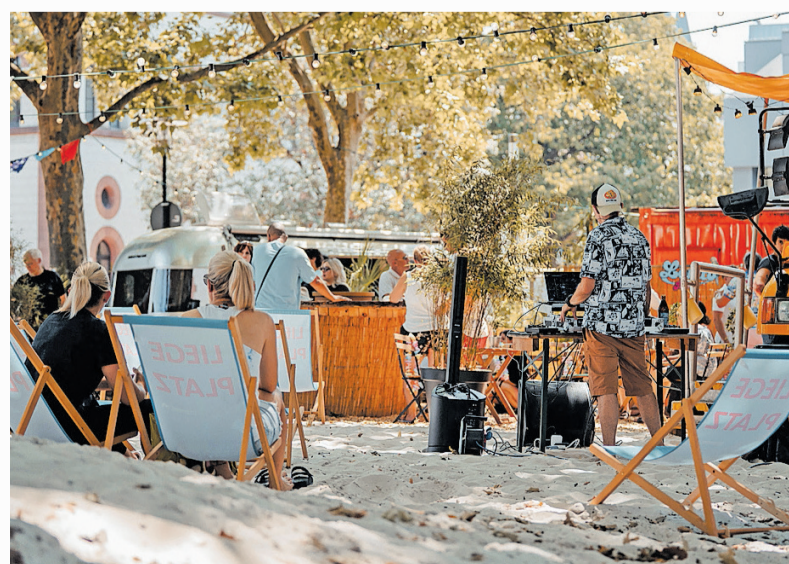
Der Strand mitten in der Stadt lädt alle Bürgerinnen und Bürger dazu ein, den Sommer zu genießen

„Die ‚Lorito Beach Bar‘ lädt alle dazu ein, hier Zeit zu verbringen“, freut sich Oberbürgermeisterin Beate Kimmel über den großen Mehrwert des sommerlichen Areals für die ganze Stadtgesellschaft. Kinder können im Sand spielen, Jugendliche und Erwachsene können ganztägig im Außenbereich entspannen oder abends zu Musik tanzen. Und die angebotenen sportlichen Aktivitäten können selbstverständlich von Jung bis Alt genutzt werden. „Ich freue mich sehr, wenn die Beach Bar dazu beiträgt, die Aufenthaltsqualität am Rathaus zu steigern und unsere Innenstadt auch in diesem Bereich der kürzlich fertiggestellten Neuen Stadtmitte weiter zu beleben“, so die Oberbürgermeisterin. jps