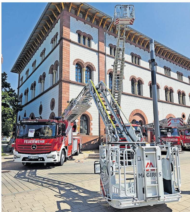
Das neue Hubrettungsfahrzeug bei den Kaiserslautern Classics vor der Fruchthalle

Zehnte Drehleiter in der Historie der Feuerwehr geht in Betrieb